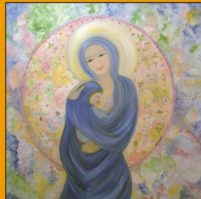
Madonna delle Grazie olio su tela - cm 100 x 100