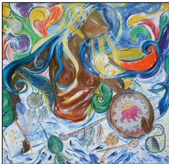
La Sciamana olio su tela - cm. 200x200