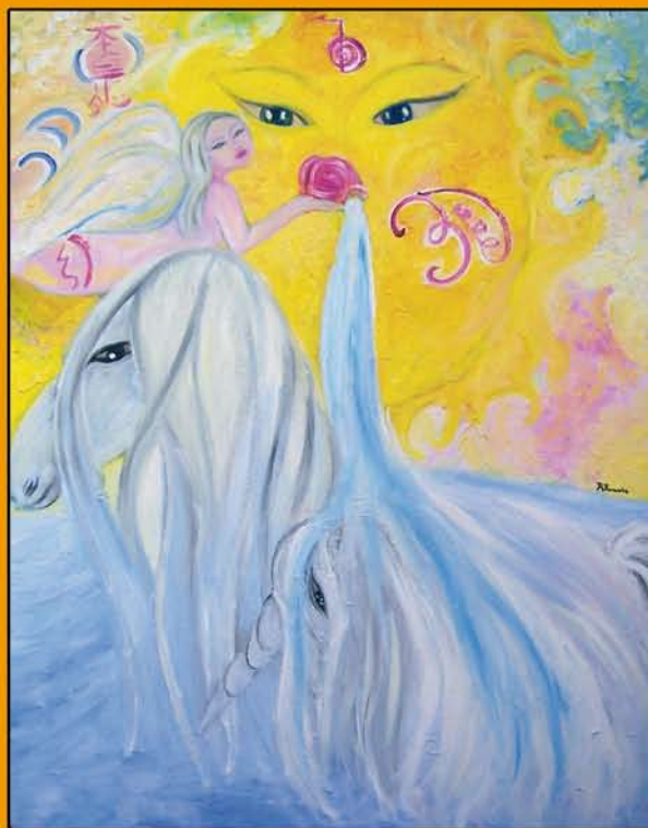
Free Spirit olio su tela - cm 80 x 100

in un universo "onirico" in cui è tutto un "Fluire" e un precisarsi "emotivo" sempre più esclusivo e personale.